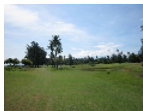
海の景観が素晴らしい名物 4 番ホール。左写真はティー・グラウンドからの眺めで、左側は海。右写真はホール付近で、左側にギリ・アイルが見える