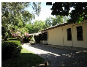
ゴルフ場のクラブハウス 付近

ここでお得な情報をお届けしましょう。Casablanca オーナーが年会員となっていますので、会員紹介でのプレー代は、通常 US80 ドルのところ、約半額の 30 万ルピア (3000 円弱) で